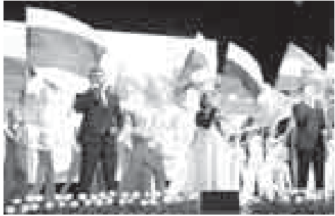
Ахыры. Аллы 1-чи бетеди.

Биринчилени санында уа гербин, гимни бля байракны эмда кырал тилгени юсюринден законла жарашдырылганда. Алай бек магыналы иш а КьМР-ни Конституциясы кыабл керюлгени болганды. Ол КьБарты-Малкыр Россей Федерацияны кууумунда жалынкысыз республика болганын токташдырылганды.