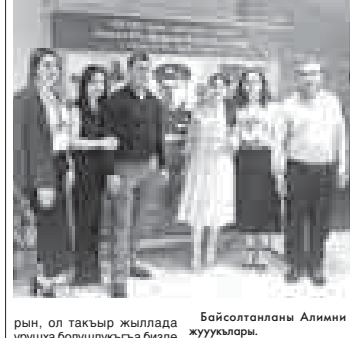
Байсолтанланы Алимини жууукьлары.

Ахыры. Аллы 1-чи бетеди. Аны бля бирге ол малкьзар халкыны арасында фашым бля урушка кыатышханла хал юйорде да болганыла-