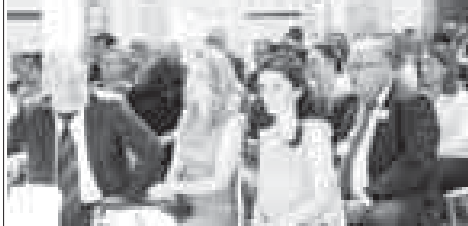
жангы торлосонне келмрге болушуркы сервисленин жашауда бардырып башлаганын айтханды. Эм алга адамын хунерине, билимине кыарат, арта ол не жаны бля жетишимли кюреширге болугун энчилеп, анга кесин ачыкларыга, айнытырга сөбеллик этерик торло-торло технолгиялы проектлеге кыатышгырга онгла кыраллыкыларын билдиргенди. Андан сора да, телемостну кезиучюне сөлөшкенде «Точка кипения» формат – ол сеть баймалык болушуркы сервисленин жашауда бардырып башлаганын айтханды. Эм алга адамын хунерине, билимине кыарат, арта ол не жаны бля жетишимли кюреширге болугун энчилеп, анга кесин ачыкларыга, айнытырга сөбеллик этерик торло-торло технолгиялы проектлеге кыатышгырга онгла кыраллыкыларын билдиргенди. Андан сора да, телемостну кезиучюне сөлөшкенде «Точка кипения» формат – ол сеть баймалык болушуркы сервисленин жашауда бардырып башлаганын айтханды. Эм алга адамын хунерине, билимине кыарат, арта ол не жаны бля жетишимли кюреширге болугун энчилеп, анга кесин ачыкларыга, айнытырга сөбеллик этерик торло-торло технолгиялы проектлеге кыатышгырга онгла кыраллыкыларын билдиргенди.