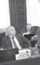
Аны айтханына кере, республика «Жашу журт», «Шендою сахар болум»,

кытышады. Битеу да бирге бийыл 145 арбаз эмда халк аслам жыйылган