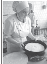
Нальчикде Къабарты-Малквар гуманитар-техника колледжде сауукъл жаны бла чекленген онглары болгъанлары «Абилимпикс-2019» деген ючюнюк регион чемпионатлары бардырылганды. Юч конюню ичинде (20-22 июнь) конкурсантла – битеу да 70-ге жуукъ адам – «школчу», «студент» эм «специалист» деген кызуумлада эришгенди, «тегерек столлагъа», торлю-торлю усталыкъларга кьре кыралгъан мастер-классла кытышхандыла.