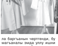
Магъаналы эмда улуу ишчи кырагъанлары барысына да жюрге ырызлыгъын билдиргенди.