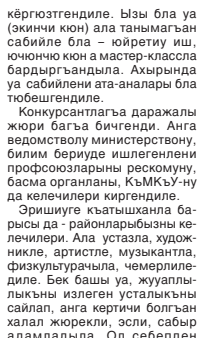
Энди Гуппойланы Асият Москвага битеросей конкурсу кырал даражалы кезюню Къабарты-Малкварны атындан кытышшырды. Анга жетишмил болуп кыайтырын тежөйбиз.