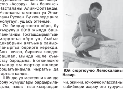
Юй спортчуно Лелюкаланы Назар. эки, экинчи, ючюнюк классланы сабийлери жаруу эте турурча