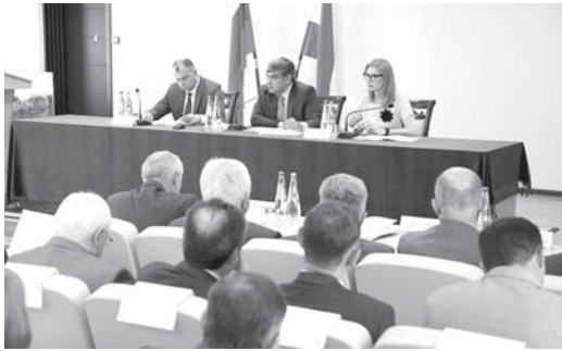
айтханы бла Жууукь Кюн-чгышыны кьырларын-да къауылга эмда уруш кьайтарылганын сабиле бла юретиу, англатыу иш