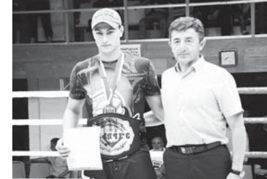
Голойланы Аслан спорт комитетини келечили Жапугулары Магомед бла.

эм башка регионладан спорт клубланы келечилери къатышандыла. Рингге жыл санларына юешинген эки къауумдан спортчула чыккандыла – акыбалыкыла эмда юниора. Ала аурулукларына кере эришгендиле.