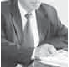
Тюшген оюула жулдыз ызагыла ушай эдиле? Эн кылдан, хэдден да уста эди.

Цыпракыламы шыбырайдыла өгөсө Эвени эмиш чабырчу чабырчу чокмо айтад халар? Неда сууцак кыскай кылкыими энип келедиле таудан? Теир- леми унадыла, акыктаган атларны минип, көдө? Алага махтау сала, жумарууламы кычырадыла бийкеде? — Көк Теирси, тилеклери жетемдиле сен турган бийкеде? Өгөсө анда кыа- зат энип уюк сөйлөткөндө, дауулар көк кюкорегени, элиа урганы жутулуу кыдыла жюргөми кычырыгыт? Жууап жюдыу. Сен чалыкны жырып барса. Жолсу жулунг тауадыла. Бийке. Көк теирсини жуубан эшитир ючюн.