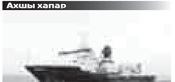
2019 жылны 8 сентябри