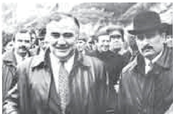
КъМР-ни президенти В.М.Коков бла Туменланы Мурадин.

(Люба, Ариуба эм Нуржан) ѳсдюре тургъанлай, Уллу Ата журт уруш башланып, ары кетгенди. Сермешледен биринде жаралы болуп, иги кесекни госпитальда жатханды.