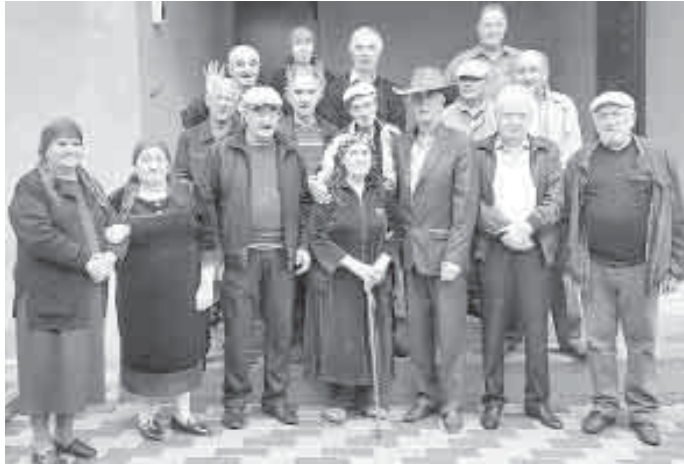
жыйынлык алагъа Аллах бермесин. Биз школну бошаганлы быйыл элли жыл толганды. Бу жол да

Бушууда , кыуанчда да классыбызны жашлары, адамланы ичлеринден айырылып келип, саламлашып, тансыкларла. Бир ненча кере тубеши кырап, бирге жыйылып олтурганбыз. Ол бары да хурмет эте билгенни, намысны юлгюсюдо. Сау болсунла, бизни сыйлагандан уллу