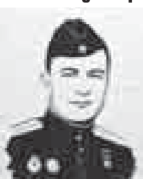
Турганла да көп эдиле.

Жашыкы арбада олтуруп, кёкге кырап, бир затла мурундап барады. Атасы у: «Не затла шырбыраиса, аныгылачы»,- дейди. «Миччыкчыла, кекде учарга союме»... Алай атасы аны темир жолу эгерге излегенди. Жаш, училешке окуй турганлай, Йошкар-Ола шахарда лётчиклини хазырлаган аэроклубка алуу барганын эшитип, олсатат ыразылгын билдиреди. Анда тынгылы юйренгенден сора у, кеси да сагынылган маккемеге башчылык этип, 1938 жылдан 1942 жылга дери алты жюздөн аспам адамга усталык бергенди.