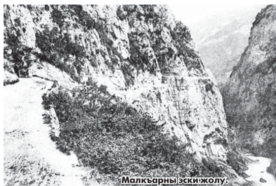
Малкварны эски жолу.

Алайдан да 6 кычырым ёрге барсанг, таудан келген суугъа тюбериксе. Ол тийрени адамы анга Къара суу дейдиле. Анда кыолан (форель) чабакъ кёпдү. Таулада аллай атлагъа терк-терк тюберге боллукъду. Кыаралдым ташлары, юзмези кеп болгъан, кеслери да тынч баргъан суула кыаралдым кёрюнедиле.