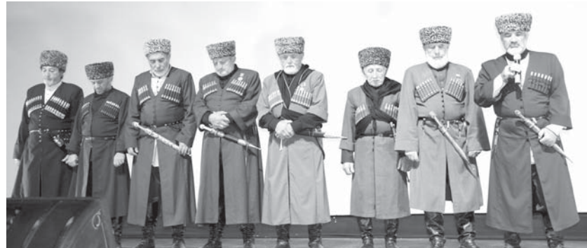
Къарачайдан келген акъсакълла.

Фильм баргъан эки сагъатны ичинде залда олтургъанла шум болуп тургъандыла, ол ауу шошлукъну тишируланы угъай, эр кишилени окъуна да терен ахтынганлары, жиялгъан