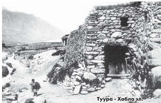
Туура - Хабла эл.

жыл мындан алда орусла жолоучуну оюмларын, сезимлерин сизге баям этейик.