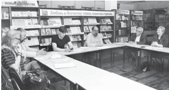
Мастер-класс барган кезиуде.

МУСУКАЛАНЫ Сакинат.