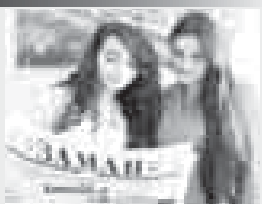
Бизни индексбиз – 51332

Багъалы оқуучуларыбыз! «Заман» газетге 2020 жылны биринчи жарымына жазылуу андан арты бардырылады. Сиз ана тилибизде чыкъгъан газетни алырсыз, оқурусуз, ол хар биризини да эсли кенгешчиюз, оғурулу сёз негериз болуп туруп деп бек ышанабыз.