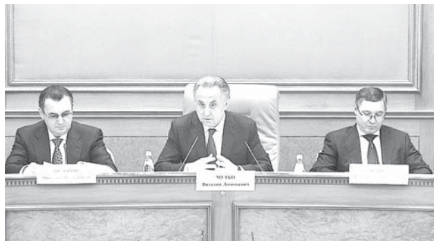
КъМР-ни Башчысыны бла Правительствосуну пресс-службасы.

«Экология», «Къоркъуусуз эмда тынгылы автомобиль жолла», «Урууну хайырлыкъларын кётюрюу эмда иш бла жалчытыу», «Илму», «Цифралы экономика», «Гитче эмда орта предпринимательликъ бла энчи предпринимательство жаны бла башламчылыкъга себеплик этиу», «Халкъла аралы кооперация бла экспорт) паспортлары бла Магистраль инфраструктураны жангыртуу эмда кенгертиу жаны бла комплекс план къабыл этилгенди. Аланы толтуруугъа 2024 жылгъа дери 25,7 триллион сом бёлюнорюкду.