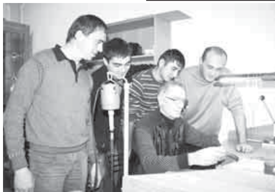
Мусабий жашланы юйретген кезиу.

дан устача, жырлай, тепсей да биледи. Аны кьой, назмула да жазды. Алай ийменчек адам болгъаны себепли ала-ны бир заманда да басмаламагъанды. Алгъаракълада уа Черек районда Чирик кьелю жагъасында «Алтын кьол» фестивалга агъачдан бла кийик мюйюзледен ишлеген шинтикленни бла столланы келтиргенде, мен бек сейир этгенме, ол кеси ишлеген затладан кьормюч кьуаргъа унамай тургъаны билеме да. Сьез ючюн, Нальчикде Суратлау искусстволаны музейинден, Пятигорскде, башха шахарладан да бар эдиле андан аны тилегенле. Уста унамагъанды. Художниклени союзуна ала эдиле да, анга да кирирге суймегенди.