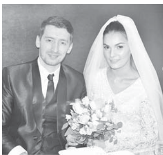
кюннге күчлене, кенгерге барсын, юлгюге айтылырча болсун!

Биз, жууукъла, ахлула, танышла, шухла да, бу эки да жаш адамгъа насып тежейбиз. Юйюрлери күнден-