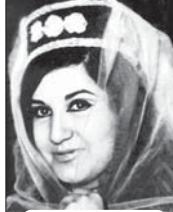
Ураджылагуэ цIарыуэ БжыныкIэ Амалы (Тяруб), Иордания (XX лл.)