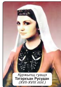
Куржыпц гуашэ Тэтэрхан Русудан (XVII-XVIII лл.)