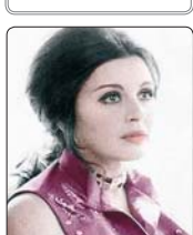
Киноактрисэ цIарыуэ Хуеин Суад (Мысыр)