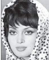
Тырку киноактрисэ тельщыжэ Шора Туркхан