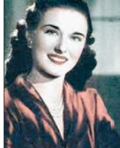
Мысыр киноактрисэ цIарыуэ Фахуреддин Мариам (XX лл.)