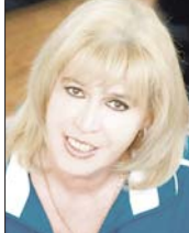
Ажымын Елена - волейболымкIэ Олимп чемпионка (1980)