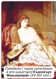
Сулейман I тырку султаным и ялэ шхэгъусэ Къанокъуэ Махьидверан (XV-XVI лл.)