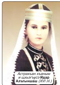
Астрахан хъаным и шхэгъусэ Идар Алтыншаш (XVI лл.)