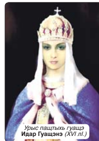
Урыш паштыхэ гуашэ Идар Гуашэно (XVI лл.)