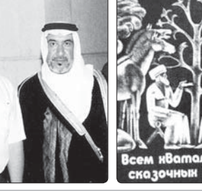
Сæм Ибаналæу сгъæуæи дорæу...