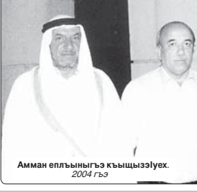
Аминæ æлпæныгъæуæи къыссыгъæуæу. 2004 гъæ