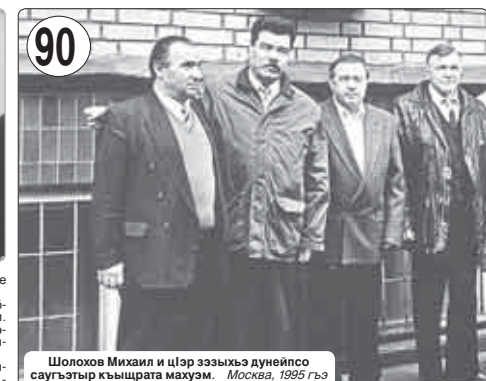
Шолохов Михаил и шэр эззыкьэ дунейсо саугьтыр кышчырата макум. Москва, 1995 гьэ