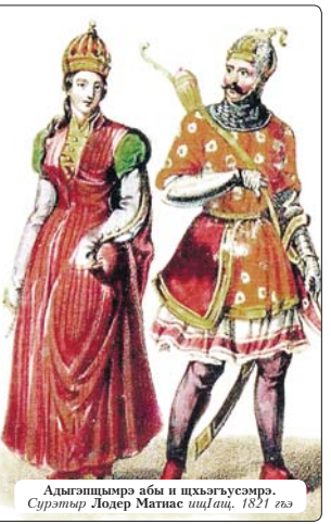
Адыгэпшыра абы и шхэгъэусэра. Сурэтэр Лодер Матнас шццлац, 1821 гъэ