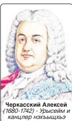
Черкасский Алексей (1680-1742) - Урысей и канцлер нэхъыщхэ