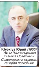
Къизүкүзэ Юрий (1955) - УФ-и Шылагъуэныгъэ-гъомкэ Советым и Секретарым и къуэдзэ, генерал-полковник