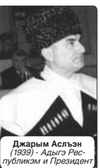
Джарым Аслан (1939) - Адыгэ Республикэм и Президент