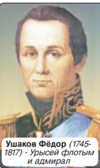
Ушаков Фёдор (1745-1817) - Урысей флотым и адмирал