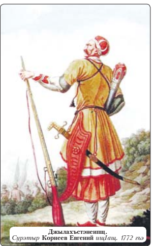
Джылахъстэныпши. Сурэтэр Корнеев Евгений шццлац, 1772 гъэ