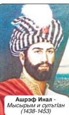
Ашрэф Инал - Мысырым и султлан (1438-1453)