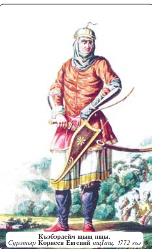
Къэбардейм шыц пшы. Сурэтэр Корнеев Евгений шццлац, 1772 гъэ