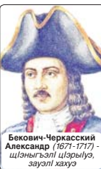
Бекович-Черкасский Александр (1671-1717) - шцэныгъэл царьыуэ, заул хакъуэ