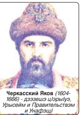
Черкасский Яков (1604-1666) - дзэзэшэ царьыуэ, Урысей и Правительство и Унафрщ