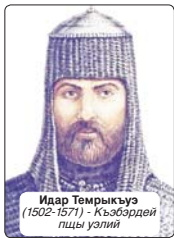
Идар Темрыкүз (1502-1571) - Къэбардей пшы узлий