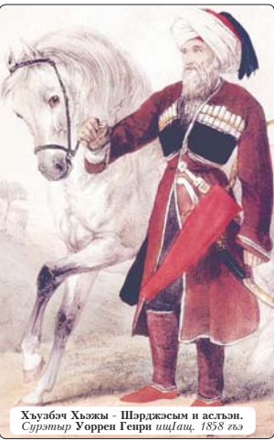
Хъуабэч Хъэжы - Шарджосым и асылан. Сурэтэр Уоррен Генри шццлац, 1858 гъэ