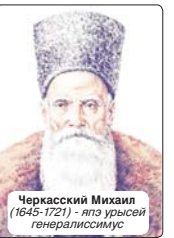
Черкасский Михаил (1645-1721) - ялз урысей генералиссимус