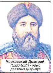
Черкасский Дмитрий (1586-1651) - урыс дзэзэшэ царьыуэ