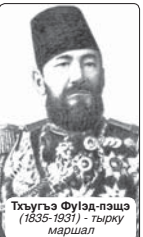
Тхугъэ Фуад-пщэ (1835-1931) - тырку маршал