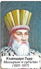
Къанзаур Гур - Мысырым и султлан (1501-1517)