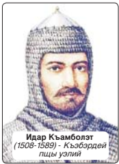
Идар Къамболат (1508-1589) - Къэбардей пшы узлий