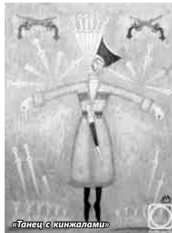
«Танец с кинжалами»

видимого мира. В многомерное пространство его картин искусно введены реальные и фантастические объекты, в нем сосуществуют параллельные миры, видимые и невидимые, относящиеся к прошлому, настоящему, а то и к будущему. Автор воссоздает фрагменты самых разных эпох и цивилизаций - как реально