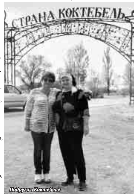
Подруги в Коктебеле

Моя же подруга домосед, занимается огородом, садом. Но когда появляется возможность куда-то вместе съездить,