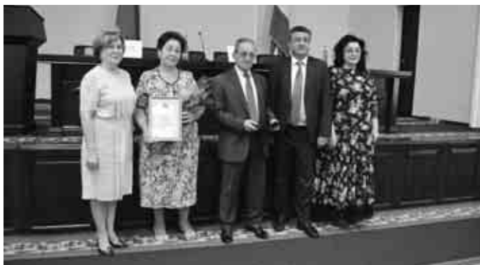
В рамках празднования Всероссийского дня семьи, любви и верности в местной администрации городского округа Нальчик прошла торжественная церемония награждения медалью «За любовь и верность» лучших семей.