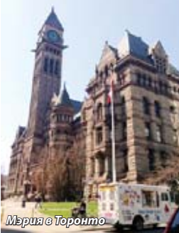
Мерия в Торонто