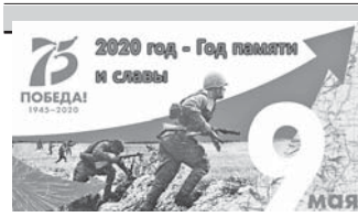
2020 год - Год памяти и славы. ПОБЕДА! 1943-2020