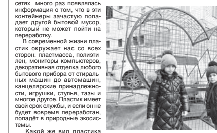
Корреспондент «КБП» посетил в крупных магазинах столицы республику, чтобы после согласования места с администрацией Эльбурского района будут установлены у этого в эту пятницу.

Появившиеся в некоторых дворах многоквартирных домов оранжевые контейнеры для пластика – первые ласточки раздельного сбора мусора в нашей республике.