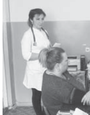
В Кахуне свято чтут память

Сельский бюджет в 2020 году составляет порядка восьми миллионов рублей. Львиная доля этих денег будет потрачена на изыскательские работы. Местной администрации предстоит подготовить проектную-сметную документацию для вхождения в федеральную программу по строительству новой врачебной амбулатории, замене