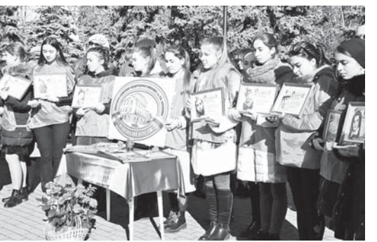
теранов Великой Отечественной войны, в Нальчике – всего 56. Мы должны сделать их жизнь максимально комфортной. Что мы можем сделать для тех 27 миллионов, лежащих в земле? Для того чтобы их помнили будущие поколения, каждая семья должна посадить дерево памяти и передавать историческую правду из уст в уста. Хотим, чтобы сегодня каждый помнил, что, внося вклад в историю блокадного Ленинграда, на том, как берегли Дорогу жизни, как создавали партизанские отряды, как в течение двух недель люди построили железную дорогу, по которой пошли поезда, снабжая армию и мирных жителей. – Сегодня в республике осталось чуть больше 100 ве-

(Окончание на 2-й с.)