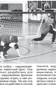
Материалы подготовил Альберт Дышкеков и Марина Биденко

То, что гольб – паралимпийская игра, известный факт. Она специально разработана для людей с нарушениями функций зрения, однако играть в неё можно и здоровым людям. Так как она рассчитана на действия в полной темноте, видящие участники должны надеть светонепроницаемые очки, тогда, сравнившись с незрячими участниками, люди, в игре они ориентируются на органы слуха и осязания, перемещая мяч с колокольчиком внутри.