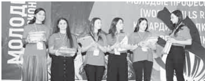
(Окончание. Начало на 1-й с.)

Церемония открытия началась с видеосюжета о ключевых моментах соревнований и работе участников на площадках. Соревнования проходили в четыре дня на семи площадках, в числе которых – Кабардино-Балкарский колледж «Строитель», Кабардино-Балкарский торговый-технологический колледж, Кабардино-Балкарский автомобильно-дорожный колледж, педагогический колледж КБГУ им. Х.М. Бербекова, Кабардино-Балкарский агропромышленный колледж им. Б.Г. Хамдохова, Торгово-технологический колледж и медицинский колледж «Признание».