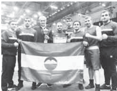
По итогам соревнований во второй группе командного первенства команда МВД...