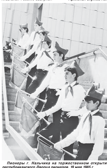
Пионеры г. Нальчика на торжественном открытии республиканского Дворца пионеров, 19 мая 1985 г.

42-69-96 E-mail: kbrel@mail.ru • РЕКЛАМА • 42-69-96 E-mail: kbrel@mail.ru • ОБЪЯВЛЕНИЯ • РЕКЛАМА