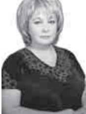
Депутат Госдумы Ирина Марьяш непрерывно ведёт приём в дистанционном формате...