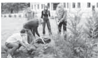
Активисты регионального отделения Общероссийского народного фронта в Кабардино-Балкарской Республике в День экологии, отмечаемый в России 5 июня, высадили декоративный кустарник на территории регионального центра по выделению и поддержке одаренных детей «Антарес» в Нальчике.

«Это не просто подарок для детей центра «Антарес», но и в первую очередь символ ответственного отношения к экологии, которое мы стараемся привить молодежи. Работа с детьми важна, так как важно заботиться об экологии, понимать ее значение для всего общества в целом, и вносить свой посильный вклад в охрану окружающей среды».