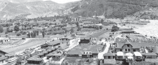
Комплекс гастрономического и экотуризма в Верхней Балкарии

Селение Верхняя Балкария – самое высокогорное не только в Черекском ущелье, но и в Кабардино-Балкарии. Оно расположено на высоте 1200 метров над уровнем моря. Здесь живут трудолюбивые, практичные, предприимчивые люди.