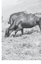
Абердины в урочище Аурсентх

Одной из перспективных пород в вопросе создания массива мясного скота для горных и предгорных районов КБР является элитный скот абердин-ангусской породы, который хорошо акклиматизирован в республике и эффертивные использует дешёвые пастбищные корма, которых в Кабардино-Балкарии порядка 220 тысяч гектаров.