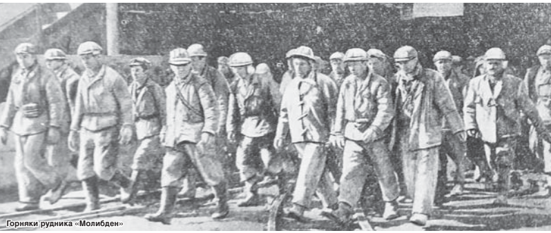
Горняки рудника «Молибден»

Восемьдесят лет назад, первого сентября 1940 года, начал производить продукцию Тырныаузский комбинат. Запуск его в эксплуатацию стал значимым событием в истории республики и всей страны. В то сложное предвоенное время и в последующий период выпускаемые комбинатом вольфрамовой и молибденовой концентраты были необходимы для укрепления обороноспособности нашего государства. Со временем горнорудное предприятие вошло в число крупнейших в СССР и являлось флагманом индустрии Кабардино-Балкарии.