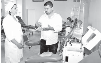
Технология в клинической медицине.

На Станции переливания крови (СПК) Кабардино-Балкарии осваивают новую технологию криоконсервирования тромбоцитов.