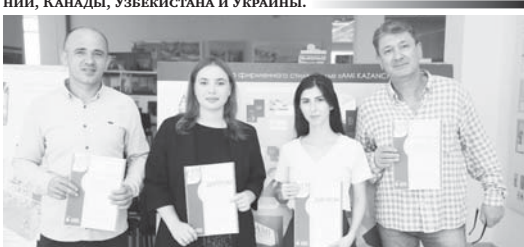
Фестиваль, цель которого - поддержка и развитие творчества в молодежной среде и пропаганда различных видов изобразительного и визуального искусства, проходил в апреле по инициативе кафедры изобразительного искусства, методики преподавания и дизайна института филологии.