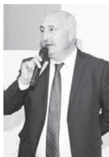
Через неделю кунаки примут участие в лагере... Через неделю кунаки примут участие в лагере...