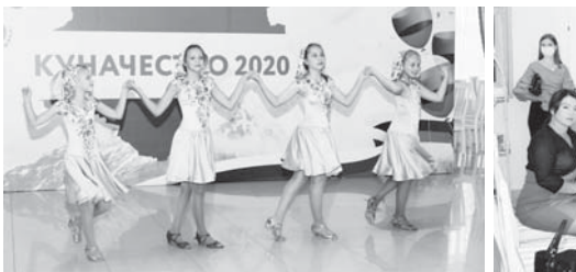
Участники «Куначества» познакомились друг с другом... Участники «Куначества» познакомились друг с другом...