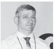
Учитель физкультуры признан лучшим педагогом Кабардино-Балкарии

В МИНИСТЕРСТВЕ ПРОСВЕЩЕНИЯ, НАУКИ И ПО ДЕЛАМ МОЛОДЕЖИ КБР ПОДВЕЛИ ИТОГИ РЕГИОНАЛЬНОГО ЭТАПА ВСЕРОССИЙСКОГО КОНКУРСА «УЧИТЕЛЬ ГОДА РОССИИ-2020».