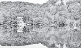
По данным опроса, туристы также отметили Кадыван в Красной Полне (6,61 процента), Баскунчак в Астраханской области (5,79 процента), Голубое озеро в Черкесском округе Кабардино-Балкарии (4,96 процента), озеро Потомое в Волгоградской области (4,13 процента), Селигер в Тверской области (2,48 процента), Сейдозеро в Мурманской об-

Большинство респондентов, а их 34,71 процента, самыми красивым озером страны считают Байкал. На втором месте (27,27 процента) – Ладожское озеро в Карелии и Ленинградской области. «Бронзу» получило Кюшское озеро, расположенное в Олуском заповеднике в Крыму. Солёное крымское озеро набрало 10,74 процента голосов.