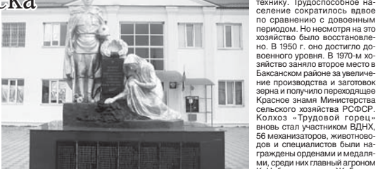
Памятник селчанам, погибшим в годы Великой Отечественной войны