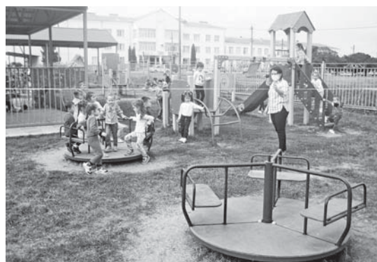
Играть в новом садике гораздо приятнее

О вкусе кишпекской воды жители Нальчика знают не понаслышке. Кишпекский групповой водозабор очень давно поставляет живительную влагу микрорайонам столицы республики. Но многие ли из нальчан, да и других жителей республики знают об истории и современности селения Кишпек, которое до революции носило другое название – Тыжево?