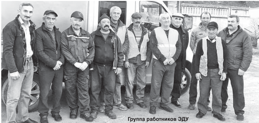
Группа работников ЭДУ

Более двадцати лет назад в Эльбрусском районе было образовано дорожное управление. Оно создавалось с целью ремонта и содержания автомобильных дорог общего пользования регионального значения и искусственных сооружений на них на административной территории района. Сначала хозяйство занималось решением одной задачи, но жизнь внесла свои коррективы, и сегодня оно обслуживает и восстанавливает муниципальные дороги.