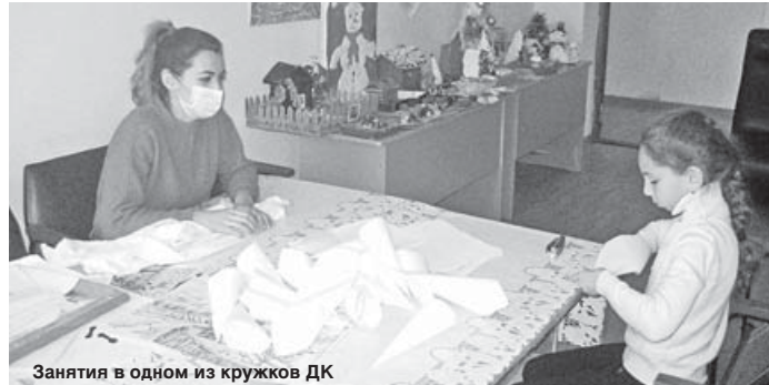
Занятия в одном из кружков ДК

ОСНОВАНИЕ СЕЛА КУБА ОТНОСИТСЯ К СЕРЕДИНЕ XVIII И НАЧАЛУ XIX ВВ. (ПИСЬМЕННЫХ ИСТОЧНИКОВ, СВИДЕТЕЛЬСТВУЮЩИХ ОБ ИСТОРИИ ЕГО ВОЗНИКНОВЕНИЯ, НЕТ. ПРЕДПОЛАГАЕМАЯ ДАТА – 1742 ГОД. В ПРОШЛОМ КУБА ДЕЛИЛАСЬ НА ДВЕ ЧАСТИ: ВЕРХНЯЯ – АГУБЕКОВО (АБГУЭЧЕЙ) И НИЖНЯЯ – АТАЖУКИНО (ХЪЭТЫКЪУЩЫКЪУЕЙ).