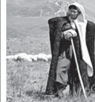
Пастбищный сезон-2020. Урочище Гедмихи

ИТОГИ МИНУВШЕГО ПАСТЫШНОГО СЕЗОНА В КАБАРДИНО-БАЛКАРИИ ПОДТВЕРДИЛИ, ЧТО В ПОСЛЕДНИЕ ГОДЫ СТЕПЕНЬ ВОСТРЕБОВАННОСТИ И ЗАГРУЖЕННОСТИ ЗЕМЕЛЬ ОТНОСНО ЖИВОТНОВОДСТВА В СРЕДЕ МЕСТНЫХ АГРИРИЕВ ВОЗРОСЛА КРАТНО.