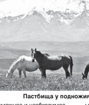
Пастбища у подножия Эльбурсы

– В частности, по Эльбурскому району в республиканской собственности зарегистрировано чуть более 340 пастбищных и сенокосных участков общей площадью свыше 85 703 га, из которых в аренду около 48 600 гектаров (степень загрузки 56,7%) – конквистат А. Тохов. – В Эльбурском районе зарегистрировано 144 участка общей площадью чуть более 33 328 гектаров, из них в пользование арендаторов находится 68 697 га (процент загрузки – 26,1). Хотел бы пояснить, что низкий процент загрузки связан с большой разбросанностью и труднодоступностью основной массы площадей земель отгонного животноводства.