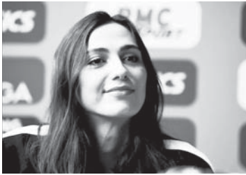
Чемпионка России 2020 года полагается по 180 тысяч рублей, серебряным призёрам – по 90 тысяч, бронзовым – по 45 тысяч рублей.

В минувший понедельник премьер-министр РФ Михаил Мишустин подписал распоряжение о выплатах денежных вознаграждений победителям и призёрам чемпионатов России по олимпийским видам спорта.