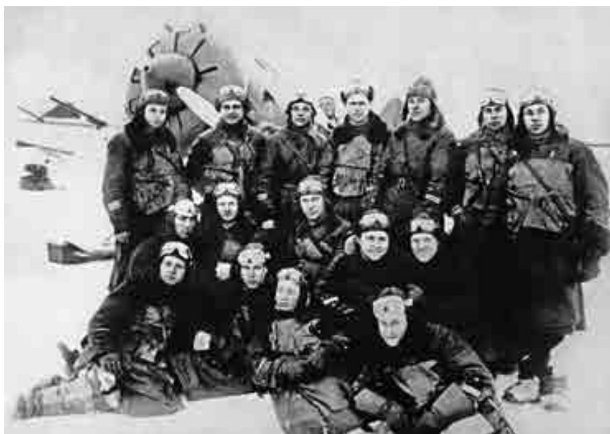
Байсолтанланы Алим нёгерлери бла