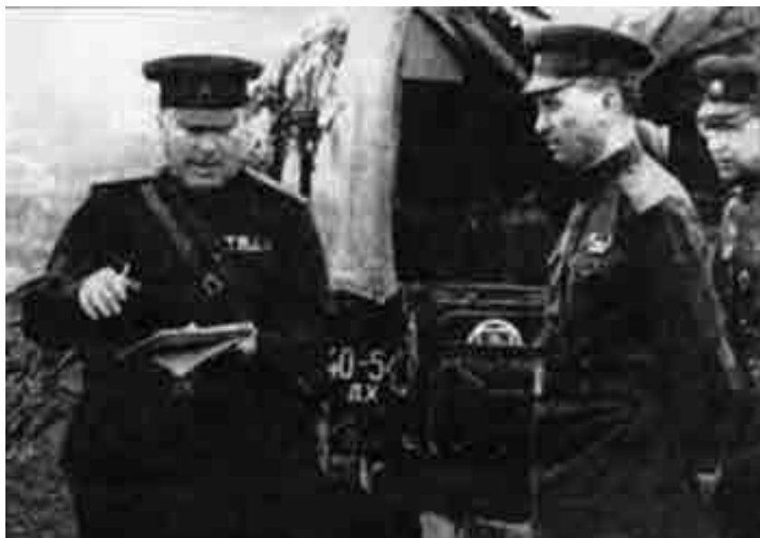
Генерал Дептуланы Хаким