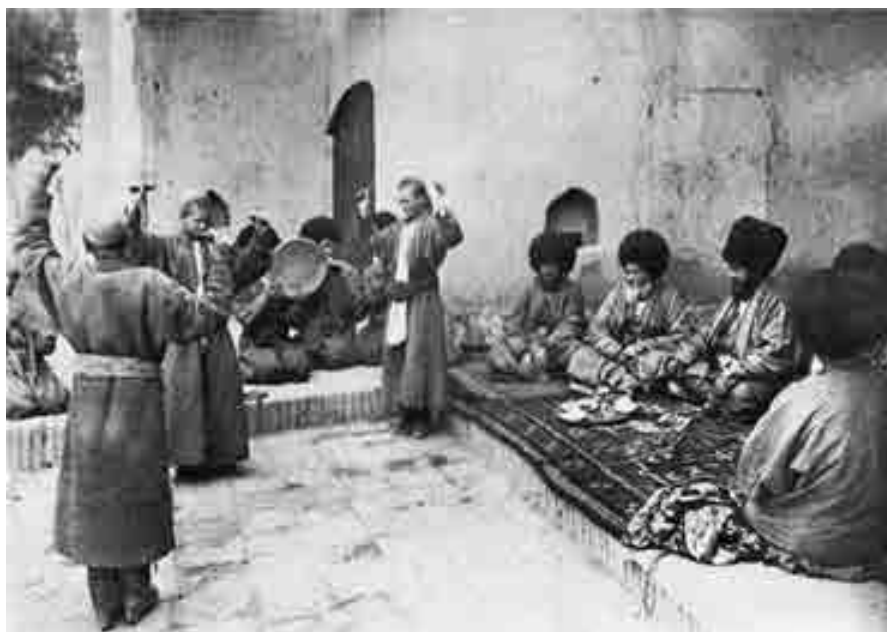
XIX ём. Эрттегили туркменлиле. Орта Азия.

лыкъ неда къаршчы туруу чыкъса, адабият да ол сезимлеге бой салып, аланы ачыкъларгъа кюрешгенди.