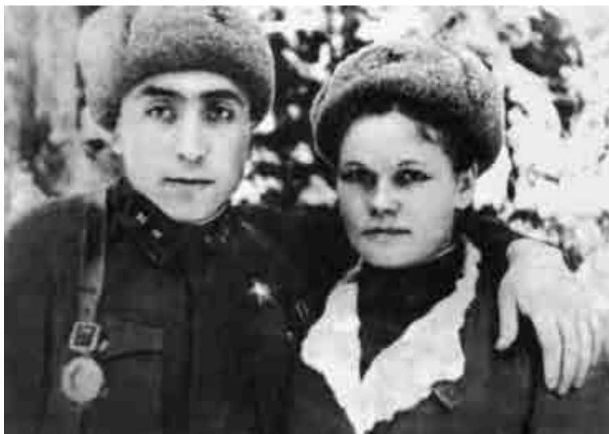
Кююкланы Магомет юйдегиси Вера бла. 1942 ж.