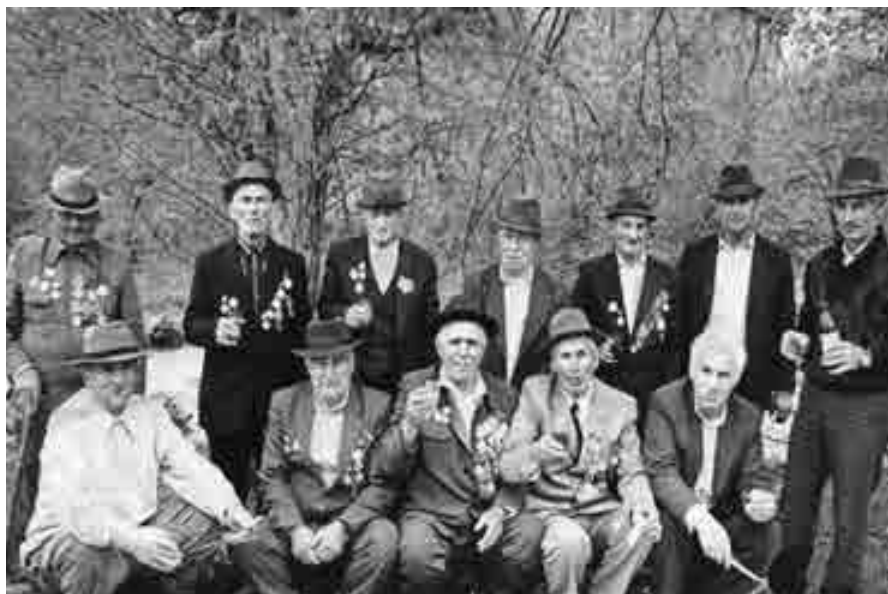
Огъары Жемталаны ветеранлары