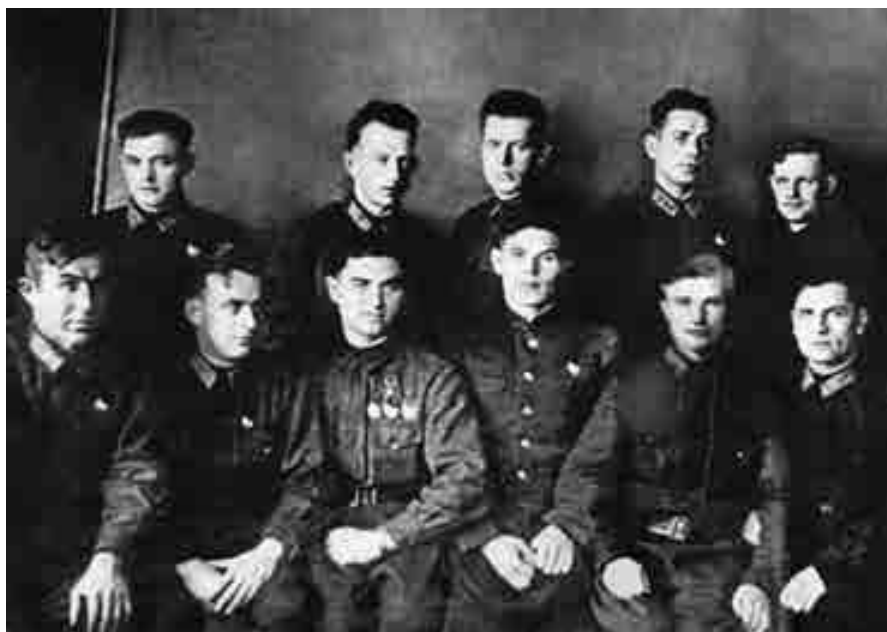
Байсолтанланы Алим нёгерлери бла