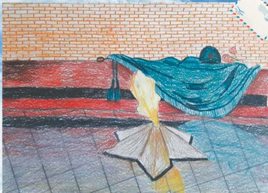
Суратны бизге Ахкёбекланы Бэла жибергенди, 4 класс, Къашхатау.

2020 жылны экинчи жарымында да «НЮРНЮ» алып туругъа суйгенле, почтагъа барып, жазылыргъа боллукъсуз. Жарым жылгъа багъасы - 100 сом жетмеген бирди. Школда окъугъан сабийи болгъаннга, 1-чи, 10-чу класслада болса да, «НЮР» бек керекди. Анда басмаланган затланы сиз бир башха жерде табаллыкъ туююлсюз. Ала сизни балаларыгъызгъа бек болушурукъдула: тилни, адепни-къылыкъны билирге, тынгылы адам болуп ёсерге. Ол тукъум затла сизге багъалы эселе, журналгъа жазылыгъыз.