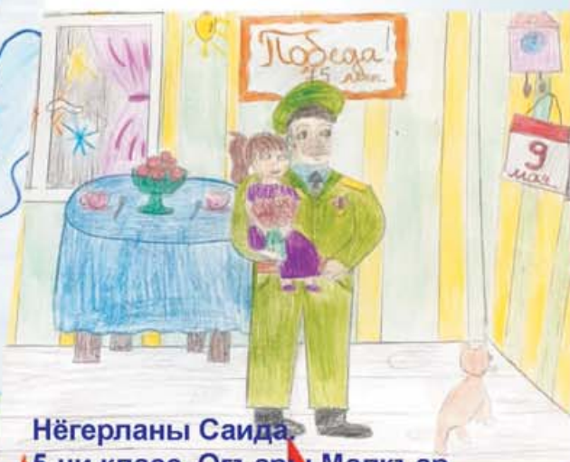
Нѐгерланы Саида. 5-чи класс. Огъары Малкъар.