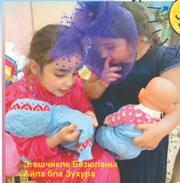
Эгешчикле Бёзюланы Айла бла Зухура

Гыдай къозучукъ, кюннге жылына, Тынгылайды къызчыкъны жырына. Шум тутадыла таула, сыртла, Тохтап къарайдыла булутла, Жарыкъ булутла.