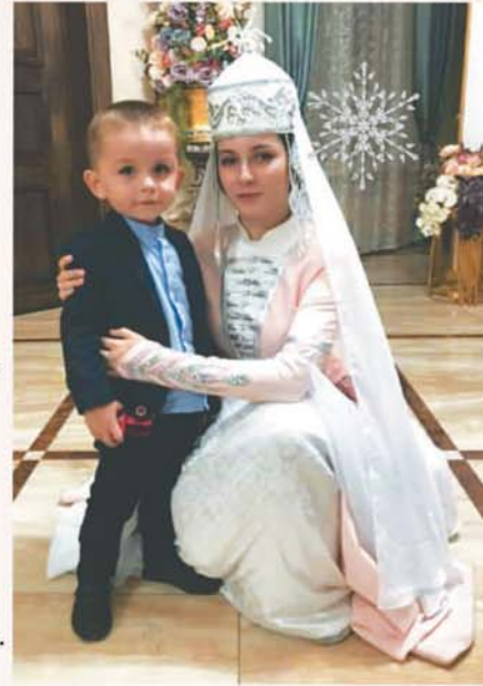
Аттоланы Алим бла Аттоланы Аида

Эшикде уа жауады къар, Тауну, тюзню жабады къар. Кечебиз той бла озуп, Дунягъа чыммакъ танг атар!