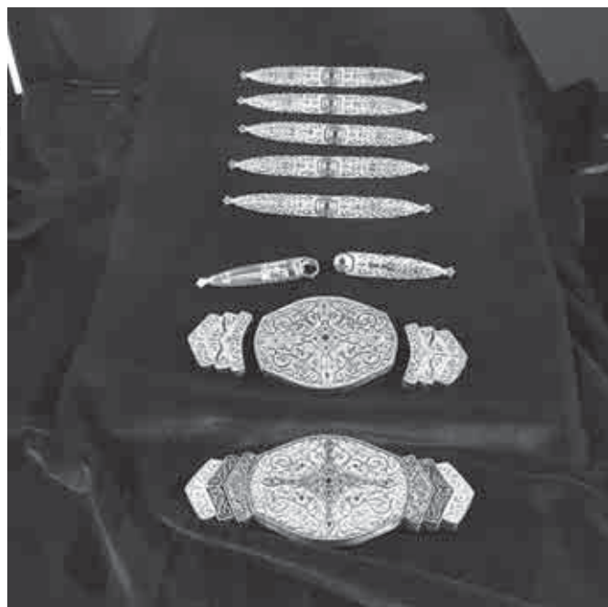
Бзылгьугьэ фашэм щыщ пкьыгьуэхэр.

Пэж дыдэу, льяп-кьым кьыдекІуэкІ фЫгыгьуэ мылгытэхэр