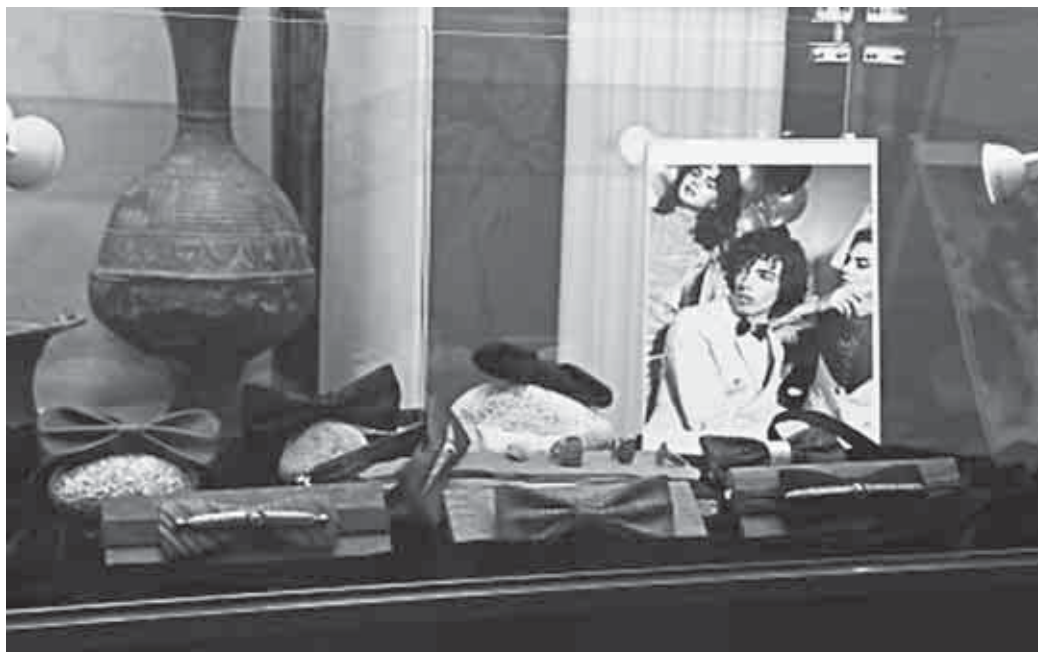
Зэкий и Иэдакъэщцэуи хэр.

Ар Иэмал хъарзынэу кыисщохъу ди льэпкъыр адрей кыомым кыегъэщцэуи хунымкцэуэ. Уи щхъэм, уи льэпкъым, уи лъахэм я закъуэ утелажэцэуэ, уи хыбар зыми зэхихынкъым, зыми укыищцэуи хунынкъым. Ауэ уи хъэпшыпхэмрэ кыидэцэуэ цэуэ хабзэмрэ Иэмал гуэрхэр кыэбгъэсэбэпрэ утыку кыипхъэмэ, хамэхэр кыридэпхъэхыфмэ, мис итцэуэ уи цэуэу кыицэуи хуныщ, уи щэнхабзэми нэхъ зиужьынущ, уи цэуэри нэхъ жыжэ цэуэ хуныщ. Арац модэмрэ адыгэ цэуэ хуэу зы щцэуэ щцэуэ.