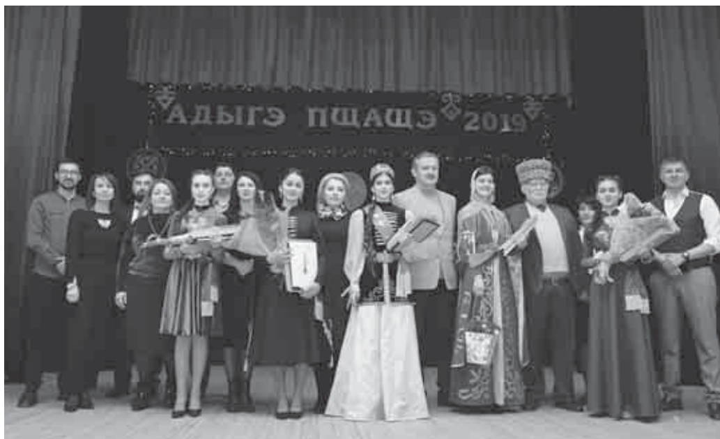
Зэпеуэм хэтахэмрэ къяпщытакIуэхэмрэ.

Хэдэгъуейт абы кыкIэлъыкIуа унэтIыныгъэм щыдагъэлъэгъуа дахагъэм. Пшыхь фащэхэр зэкIужу ящыгъыу, псы хуэм ес къазу, утыку кыихъэрт хъыджэбзхэр, дэтхэнэми адыгэ тхыпхъэщIыпхъэхэр зыхэт, нобэрей махуэм декIу фащэхэр ящыгът, пасэм адыгэ бзылхугъэм кыигъэсэбэпу щыта хъэпшып зырыз яIыгът. «Адыгэ пщашхэм и пшыхь фащэ» унэтIыныгъэм нэм щилъагъур гур хэзыгъахъуэщ, псэр зыгъэпсэхущ, гушхуэныгъэ кыпхэзылхъэщ, уи щхъэр лъагэу уэзыгъэлъагъужщ. Сыт нэхъ дахэ адыгэ фащэм нэхърэ? Ар зыщыгъ адыгэ пщашхэращ!