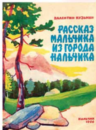
ВАЛЕНТИН КУЗЬМИН РАССКАЗ МАЛЬЧИКА ИЗ ГОРОДА НАЛЬЧИКА