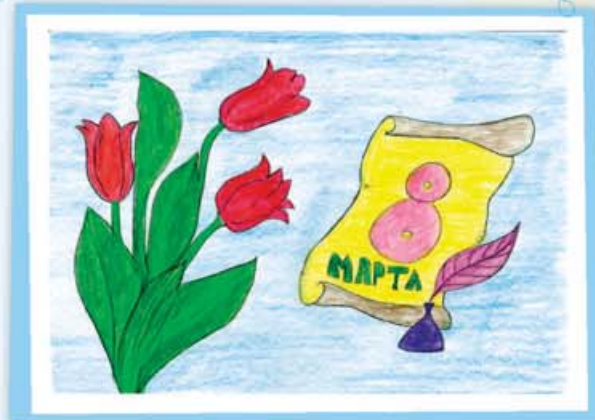
Элина БЛЯНИХОВА, 1 «А» кл., лицей № 2, г. Нальчик