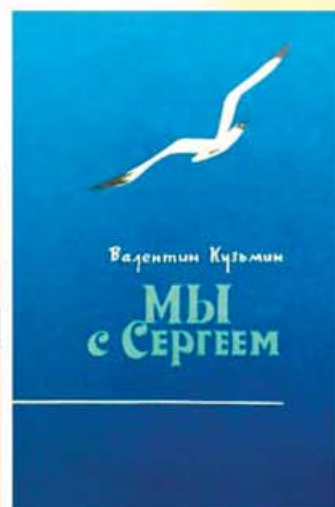
Валентин Кузьмин МЫ с СЕРГЕЕМ