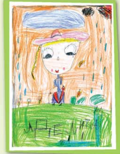
Аделита КУШХОВА, 1 «А» кл., лицей № 2, г. Нальчик