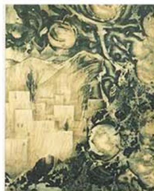
ВАЛЕНТИН КУЗЬМИН МОЙ ДОМ - НЕ КРЕПОСТЬ