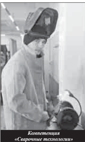
Компетенция «Сварочные технологии»

- Работа шла по пяти модулям. Первый это мониторинг состояния плодовых саженцев. Как врач оценивает состояние пациента, так наши участники должны были продиагностировать молодые плодовые деревья. Это не простой визуальный осмотр, а диагностика с помощью специального оборудования.