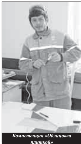
Компетенция «Облицовка плиткой»

- За три дня мы продемонстрировали, конечно, не все, но основные моменты в промышленном садоводстве – от выбора саженцев до хранения плодов. Действительно, в реальности на это надо около трех лет, но, как выявила работа в этой, пока еще демонстрационной, компетенции, показать свое мастерство и профессионализм в промышленном садоводстве можно и так – продемонстрировав свои умения на основных этапах. Сейчас у нас уже есть свой сертифицированный эксперт, думаю, будет еще. Возможно, поменяются модули – мы пока только делаем первые шаги в этой компетенции, но, надеюсь, будем ее совершенствовать, наращивать базу для работы в ней, и когда-нибудь она из демонстрационной перейдет в разряд отдельных профессиональных компетенций.