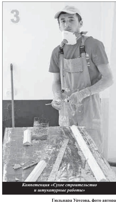
Компетенция «Сухое строительство и штукатурные работы»