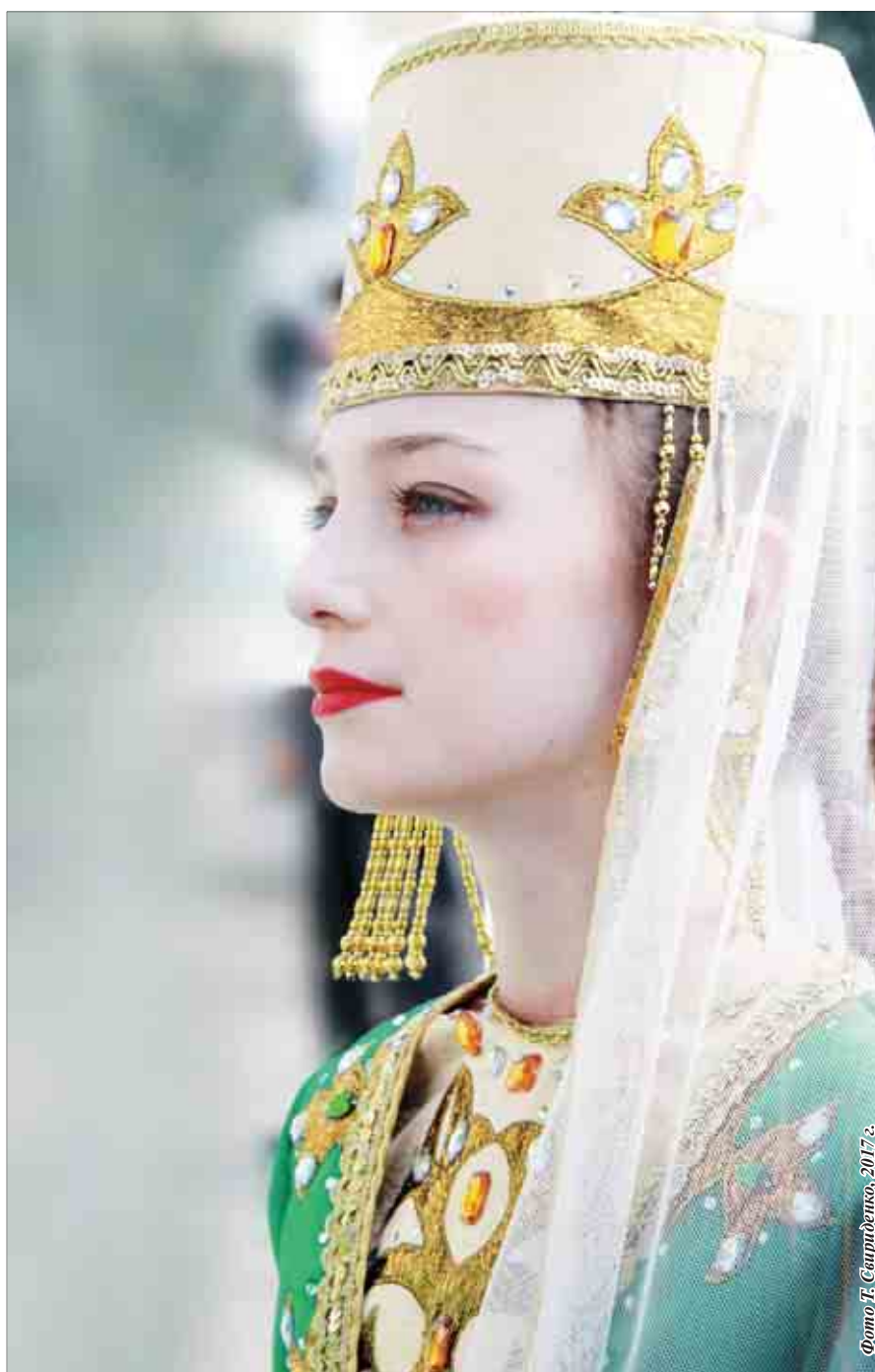
Фото Т. Свирденко, 2017 г.