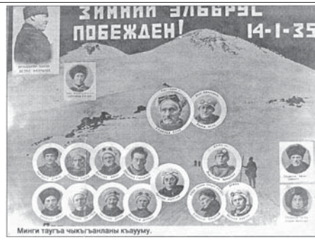
Минги таууга чыгъарыланы къаууму.