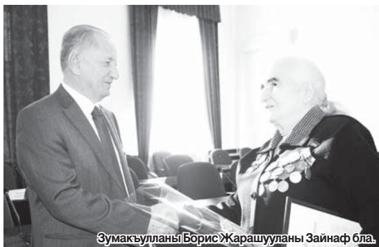
Зумакулланы Борис Жарашууланы Зайнаф бла.

Белгили французлу сурат алыучу Анри Картье-Брессонну бир иши мени не заманда да кез аллымдады. Шинтикде кьарт кьатынчык олтурады. Кезлери, кьайры эсе да узакъга кьарайдыла.