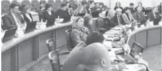
Диспансерни башчысын дагында бек жарыстан-иши кадрланы жетишме-генди. Ол айтканга кере, ахыр беш жылны ичинде ол

билдиргенлерине кере. 30 январь-гы 9720 адам болганды. Кюн сайн а ланы саны 1,6 кереге кейип барды. Ауругуанлары асламысы аба-данладыла. Ол кюнге андан 213 адам илгенди.